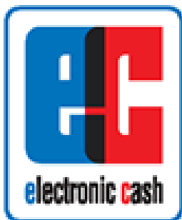
ec electronic cash

Mindestens das abgebildete Piktogramm "electronic cash PIN-Pad" oder "girocard" ist als Akzeptanzzeichen im Kassensbereich zu verwenden. Bei neu eingerichteten Kassen-Standorten ist lediglich "girocard" als Akzeptanzzeichen zu verwenden.